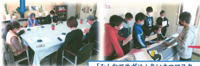
「みんなであげせ！あいさつマスター」放送の様子

2月3日に分散型授業参観と学校評議員会を開催することができました。「発達段階に応じて学び子どもたちを参観することができた」「プレゼンテーションの力がついてきている」「第1回の授業参観に比べ、ICTを活用した授業が増えており驚いた」「地域の大人がもっと関わってほしい」等、貴重なご意見をたくさんいただきました。地域・保護者・学校が、これからの時代を生きる子どもたちのために、めざすビジョンを共有し、同じ思いで教育活動を進めていく「コミュニティスクール」についても話題にしました。桜ヶ丘小学校の子どもたちを真ん中に地域と共に歩んでいきたいと思ひます。